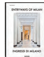
《Entryways of Milan》 Taschen Coffee table books 必需的，每本都要細心選擇。