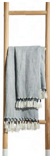
Serena & Lily Topanga Linen Throw 毛毯是所有模化的必需的單品，這些亞麻毛毯是目前的最愛。