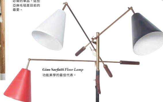
Gino Sarfatti Floor Lamp 功能美學的最佳代表。