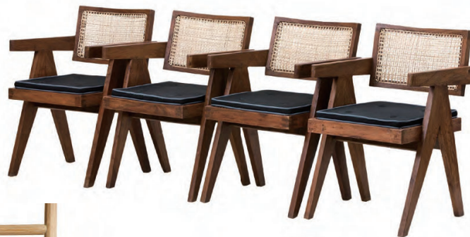
Pierre Jeanneret Floating Back Armchair 多面向，又美觀大方。