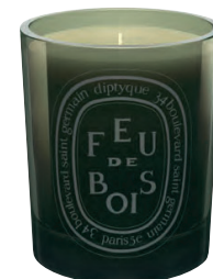
Diptique Feu de Bois Candle 其微妙的水質色彩，是我的標誌氣味之一。