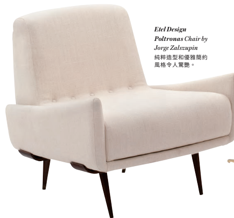
Etel Design Poltronas Chair by Jorge Zalszupin 純粹造型和優雅簡的風格令人驚嘆。